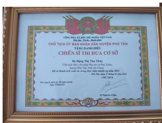
Bằng khen UBND huyện Phú Tân khen tặng Hoàn thành xuất sắc nhiệm vụ năm 2023