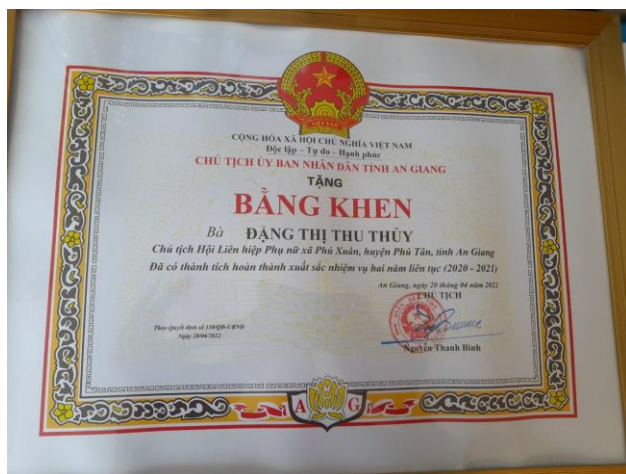
Bằng khen UBND tỉnh An Giang khen tặng Hoàn thành xuất sắc nhiệm vụ 02 năm liền

Năm 2023 đồng chí được UBND huyện Phú Tân tặng giấy khen đã có thành tích tiêu biểu trong học tập và làm theo tư tưởng, đạo đức, phong cách Hồ Chí Minh năm 2023. Nhiều năm liền đồng chí được cấp xã, huyện khen thưởng.